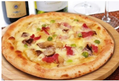
生ハムときのこの カルボナーラピッツァ