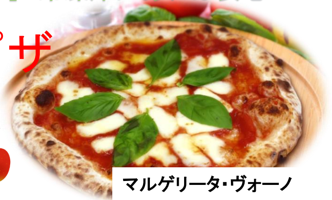
マルゲリータ・ヴォーノ