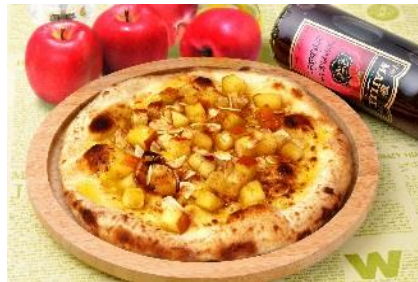
信州りんごとさつまいも