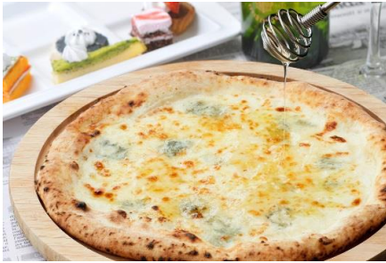
ゴルゴンゾーラと蜂蜜のピッツァ