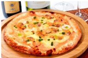
明太子シーフード

※こちらのピッツァは窯で生地を焼いてから、具材をのせ冷凍しておりますので、焼く前にパッケージ裏をご一読下さい。美味しく召し上がる為のコツが記載されております。