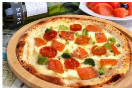
サーモンとチェリートマト