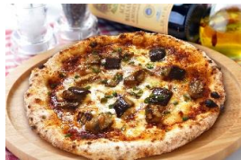
味噌ソースとなす