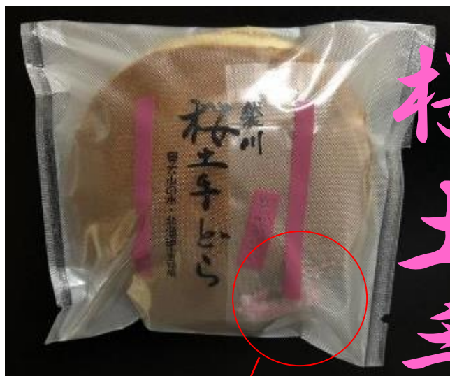
桜土手どら プレーン