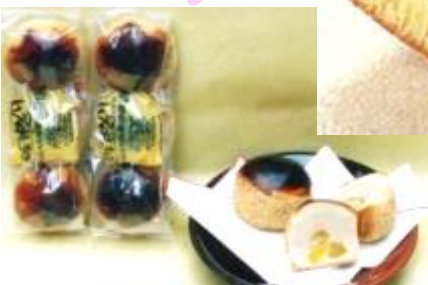
栗まんじゅう 3個入