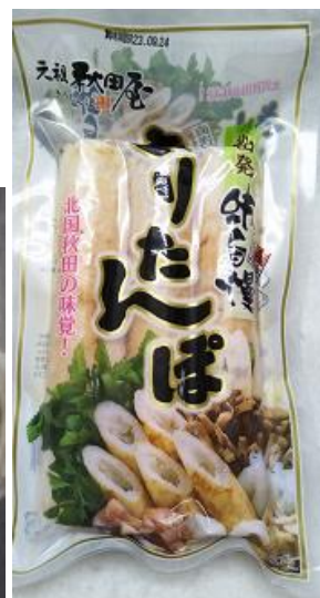
味自慢きりたんぽ 3本入