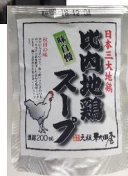
比内地鶏スープ 希釈タイプ

←肥料は有機質。農薬不使用。 除草は人の手とアイガモで、手間ひまをかけた、お米で作りました。