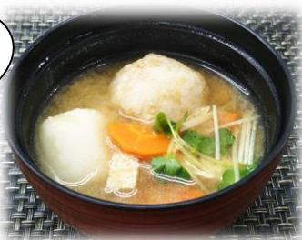
味噌汁の具材として