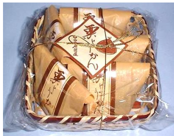
栗ようかん5個竹籠入