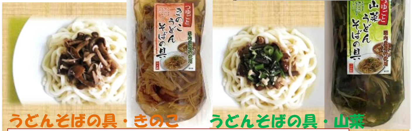
うどんそばの具・きのこ