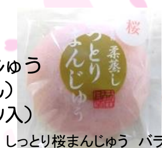
しっとり桜まんじゅう パラ