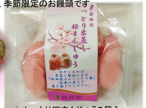
しっとり桜まんじゅう5個入