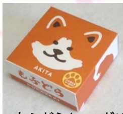
もふどら(マーガリン入)